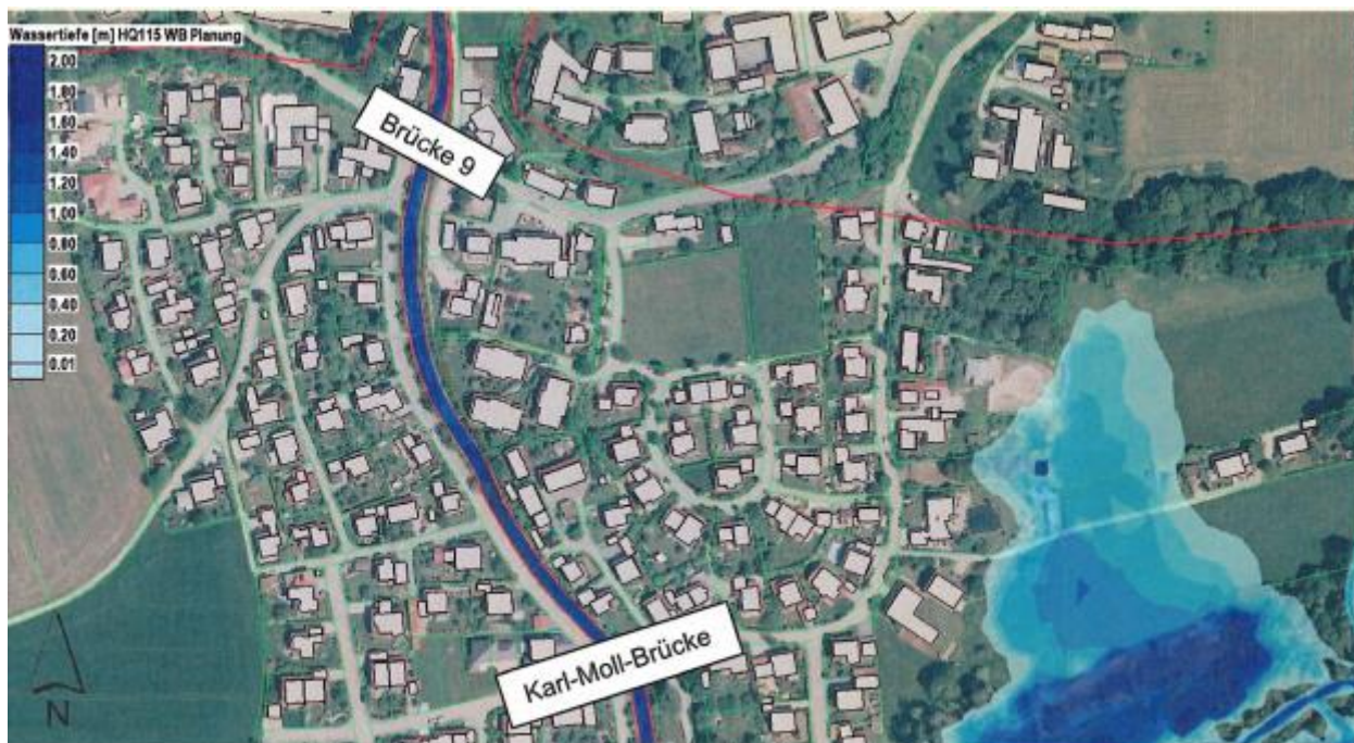
Abbildung 6.11: Gewässerabschnitt Ortsbereich Perach – Unterstrom Brücke Hauptstraße bis Karl-Brücke, HQ 100 WB inkl. 15 % Klimazuschlag